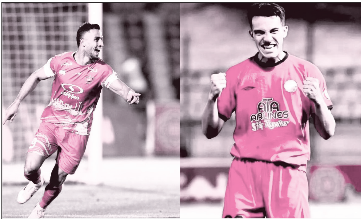
مقابل فولاد بازی خواهد کرد.